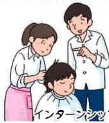
インターンシップの実施

組合を窓口とした日本政策金融公庫の低金利・長期返済の融資により経営の安定を支援しています。