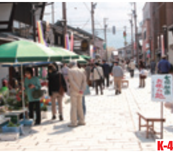
K-4 七間早市 （大野市） 這裡的早市400年前就開始了，一直是老百姓的膳食中心。 ◎舉辦期間 春分～12月31日