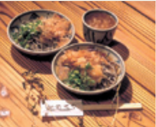
越前蘿卜泥蕎麥麵 品嘗在剛抖出來的蕎麥麵上倒上有蘿卜泥的獨特湯汁的一品。