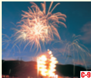
C-9 若狹大飯鎮火節 （大飯町） 火把遊行，大火勢的火焰呈現樹葉形狀。充滿幻想的仲夏夜活動。 ◎举办日期 8月上旬