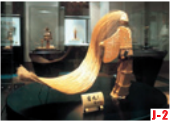
J-2 越前竹偶人之鄉 （坂井市） 陳列出不少以歌舞伎等為題材而製成的竹偶人和竹工藝品。 ☎(0776)66-5666 ◎休息日 12月26日～31日