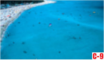
C-9 若狹和田海水浴場 （高濱町） 被選定為“舒適的海水浴場一百選”。浩瀚的沙灘和極目遠眺的藍色大海尤為美麗。