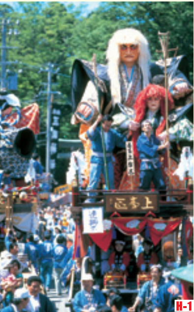
H-1 三國節 （坂井市） 載著高大武士偶人的彩車在街上行進的三國節是北陸三大節之一。 ◎舉辦日期 5月19日～5月21日