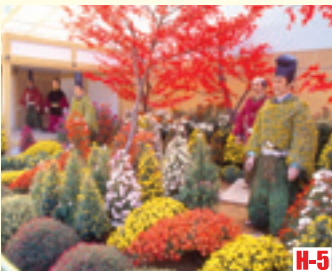
H-5 武生菊偶人 （越前市） 是秋季北陸特有的景物。菊花開得五彩繽紛。 ◎舉辦期間 10月～11月