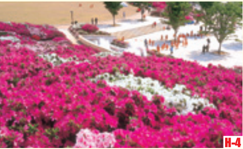
H-4 西山公園 （鯖江市） 約5萬棵杜鵑花爭妍鬥豔，是日本海側屈指可數的杜鵑花的景觀。站在瞭望台上，可以眺望觀賞遠方的白山連峰。 ☎(0778)51-1001 ◎杜鵑花盛開之時 4月下旬～5月中旬