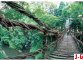
J-5 蔓草橋 （池田町） 全長44米，高12米，讓人恐怖興奮。從橋上遠眺足羽川溪谷，可以享受四季的美景。