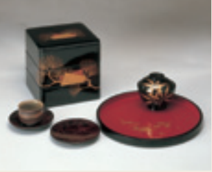
越前漆器 據傳越前漆器起源於遙遠的6世紀左右，其造型優雅，工藝精美，得到好評。

①日本有獨特的洗澡方法，不是在浴缸里擦洗身子，而是泡在裡頭暖身。可以放鬆一下疲勞緊張的身心。在浴缸外擦洗身上的污垢。進入浴缸前，稍微擦洗身上的污垢。浴池一般跟別的客人一起享用的，在這種情況下請相互禮讓。