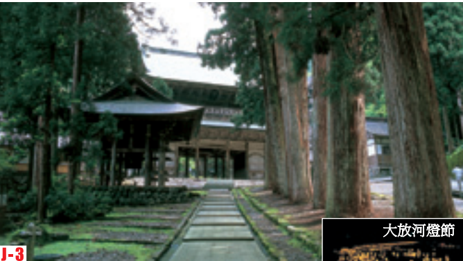
J-3 永平寺 （永平寺町） 約760年前由道元禪師創建的出家參禪的道場。 ☎(0776)63-3102