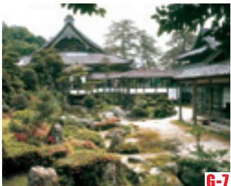
G-7 西福寺 （敦賀市）(日本的紅葉景點一百選) 四季分明且美麗的書院庭院被指定為國家的名勝古跡。 ☎(0770)22-3926 ◎紅葉似火之時 10月下旬～11月中旬