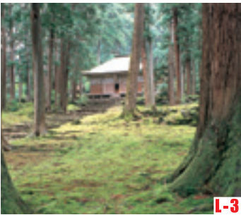
I-3 平泉寺白山神社 （勝山市） 修驗道三大聖地之一。參拜路被指定為“日本道路一百選”，因為杉樹和綠苔的幽香被確定為“香氣風景一百選”。 ☎(0779)88-1591