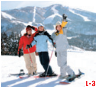
I-3 SKI JAM勝山 （勝山市） 設有西日本最大的滑雪場，MTB賽道等，是個一年四季都能享受的修養場所。 ☎(0779)87-6109