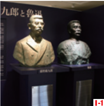
I-1 藤野嚴九郎紀念館 （蘆原市） 陳列解剖學教授藤野先生和魯迅先生師生二人的有關資料。 ☎(0776)77-1030 ◎休息日 每週星期二，12月28日～1月3日