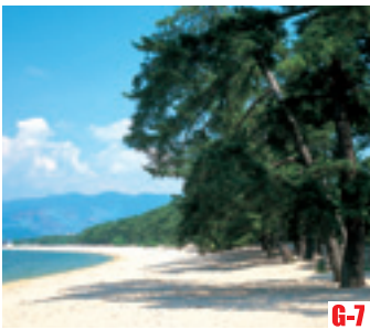
G-7 氣比松原 （敦賀市） 與虹松原（佐賀縣唐津市），美保松原（靜岡縣靜岡市）並列為日本三大松原之一。藍天，白砂和青松相交織而成的美麗景觀是大自然的傑作。國家級名勝。