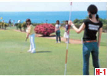
H-1 芝政世界 （坂井市） 這裡有世界最大的推桿高爾夫球場等娛樂設施，是大型的娛樂場所。 ☎(0776)81-2110