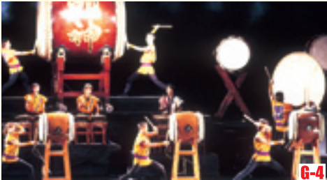
G-4 O・TA・I・KO響 （越前町） 日本大鼓的表演盛會。能夠欣賞動人心弦的演奏。 ◎舉辦日期 8月中旬