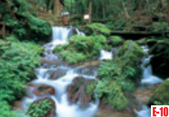
E-10 瓜割瀑布 （若狹町） 被認為「福井的名水」「名水的故鄉」 ☎(0770)62-0186