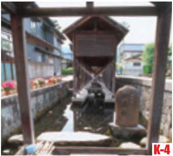
K-4 御清水 （大野市） 最具有象征意義的名泉。在村莊裡還有很多泉水景點。