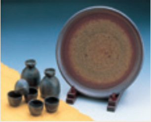
越前燒 越前燒是 福井 的名優產品，風格古樸，被認為是日本六大古窯之一。