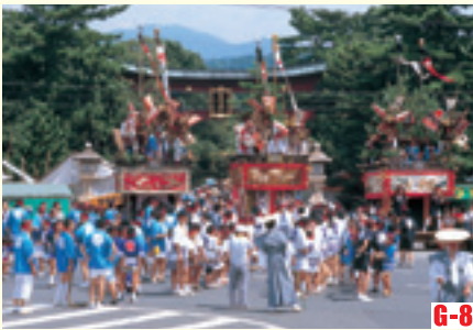
G-8 敦賀節 （敦賀市） 自室町時代流傳下來的節日遊行彩車，活動中心廣場及狂歡節遊行等都別具特色，鎮上充滿著節日的歡樂氣氛。 ◎舉辦時期 9月上旬