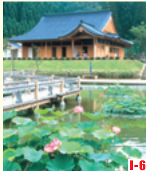
I-6 花蓮公園 （南越前町） 在公園裡展示著世界上 130種婀娜多姿的荷花，並舉辦「賞蓮大會」。 ☎(0778)47-8002 ◎舉辦期間 7月上旬～8月上旬