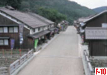
F-10 熊川宿 （若狹町） 始於江戶時代的重要驛站鎮。被確定為國家級重點保護傳統建築物群。 ☎(0770)62-0330 ◎“驛站館”休息日 每周一