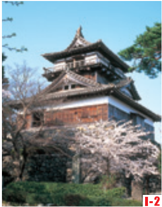
I-2 丸岡城 （坂井市） 日本最古老的天守閣瞭望樓，櫻花盛開時可欣賞到夢幻般的美景。是國家指定建築文物。 ☎(0776)66-0303