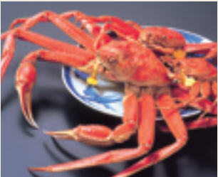
越前螃蟹 冬季時鮮極品。煮出來的螃蟹，格外美味。每年11月的捕蟹開禁期，都有眾多遊客蜂擁而至。