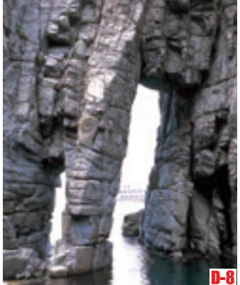
D-8 蘇洞門 （小濱市） 波濤海浪形成的礁石，洞窟千奇百態，景色極為莊嚴壯觀。