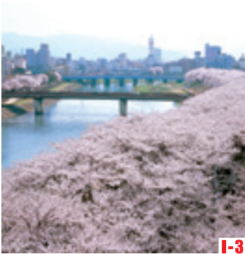
I-3 足羽河原・足羽山 （福井市） 櫻花樹並列綿延2.2公里，被確定為“櫻花名勝一百選”。 ◎櫻花盛開之時 4月上旬