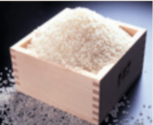
越光大米 美味大米的代名詞—越光大米，最早產於福井。