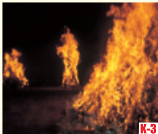
K-3 勝山左義長節 （勝山市） 自從平安時代流傳的活動之一，在元宵節那天舉行的奇特鎮火活動。 ◎舉辦日期 2月最後的周六、周日