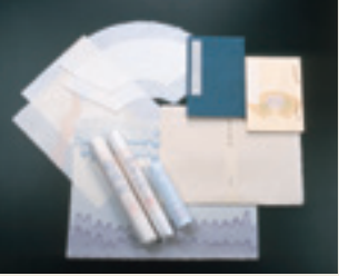
越前和紙 越前和紙具有1500年的歷史，以最高品質的和紙而著稱。