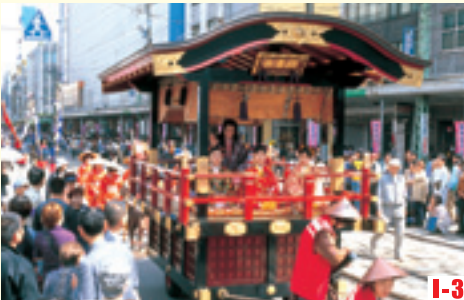
I-3 越前時代行列 （福井市） 每年4月上旬，身著戰國時代的英雄和武士服裝的人們，隨著整齊的步伐浩浩蕩蕩地穿行於市內中心地區，再現勇武時代的壯觀風景。 ◎舉辦日期 4月上旬～中旬