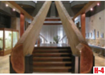
H-4 福井綜合植物園 （越前町） 這裡有從日本乃至世界各地收集的3,000多種植物，是日本海側最大規模的植物園。 ☎(0778)34-1120 ◎休息日 每周二