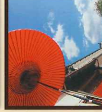
21 22 23 熊川