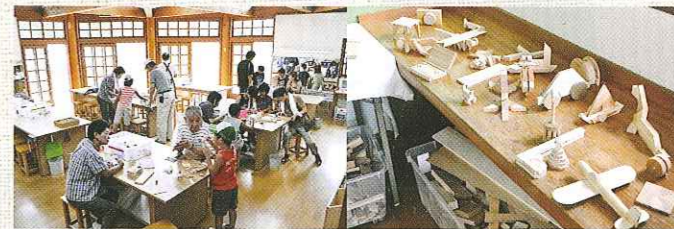
「木工館」では自由に工作が楽しめる