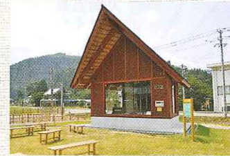
自動演奏チャ임が流れる「チャ임小屋」 新鮮な野菜などが並ぶ「たけだや」

●木工館 住所/坂井市丸岡町山竹田54-4 電話/0776-68-0364 料金/500円~(キット等各種あり。オルゴール装着は+500円) 時間/9:00~17:00 ※土・日・祝日のみ営業しています(夏休み期間中は特別開館有。)